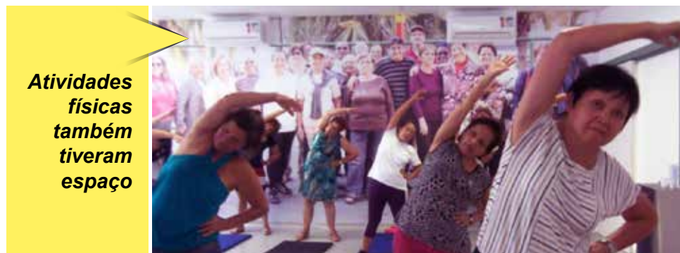
Atividades físicas também tiveram espaço