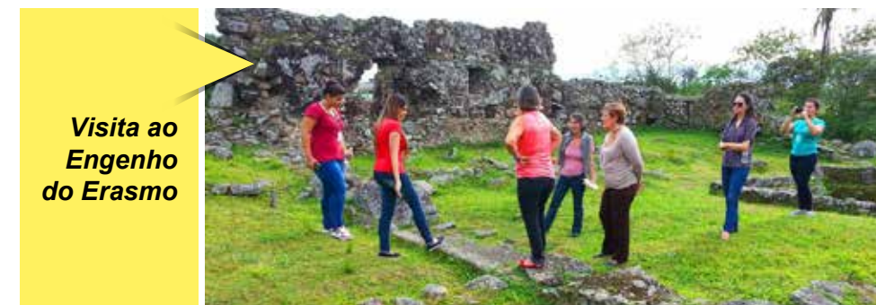
Visita ao Engenho do Erasmo