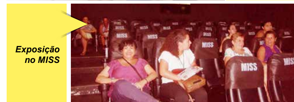
Exposição no MISS