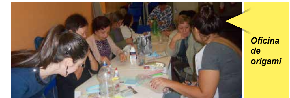
Oficina de origami