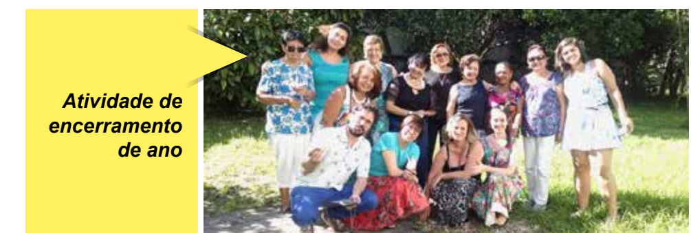
Atividade de encerramento de ano