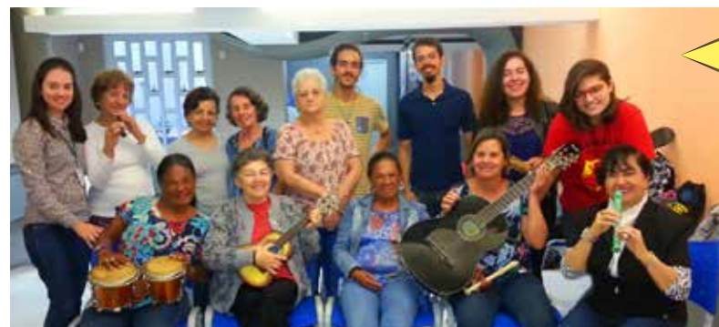
Oficina de Música