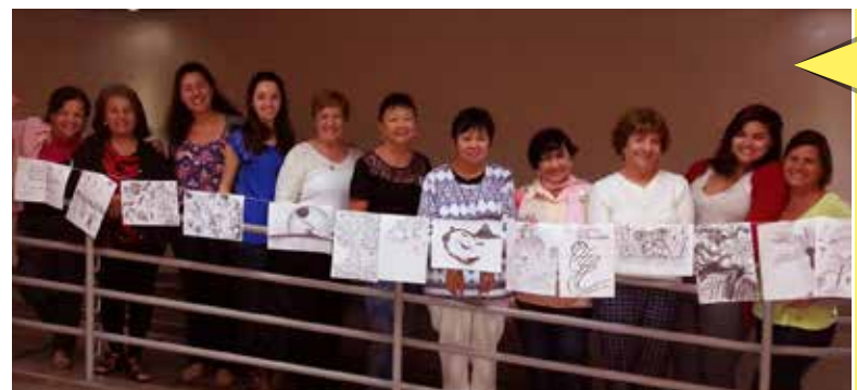
Oficina de Desenho em carvão