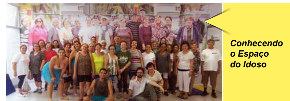
Conhecendo o Espaço do Idoso