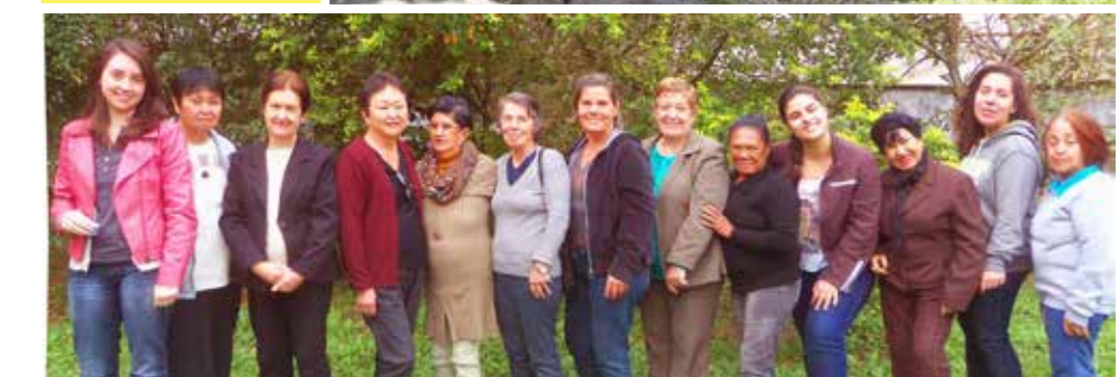
Sarau "Arte e Poesia" - Serviço Escola de Psicologia da UNIFESP