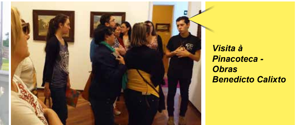
Visita à Pinacoteca - Obras Benedicto Calixto