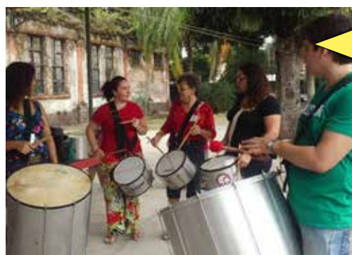
Oficina de percussão