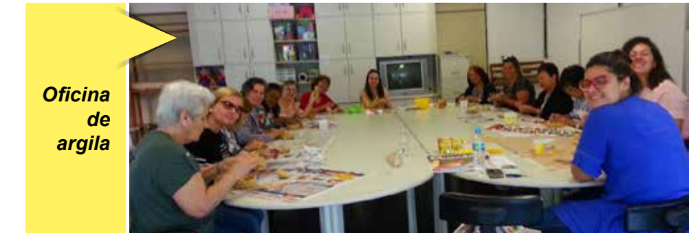
Oficina de argila