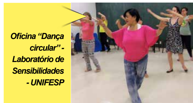
Oficina "Dança circular" - Laboratório de Sensibilidades - UNIFESP