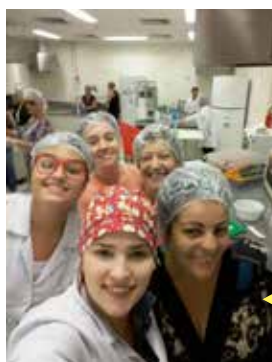
Oficina de culinária com alimentação saudável na Cozinha Industrial da Unifesp