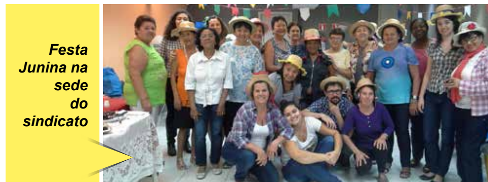
Festa Junina na sede do sindicato