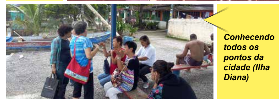
Conhecendo todos os pontos da cidade (Ilha Diana)