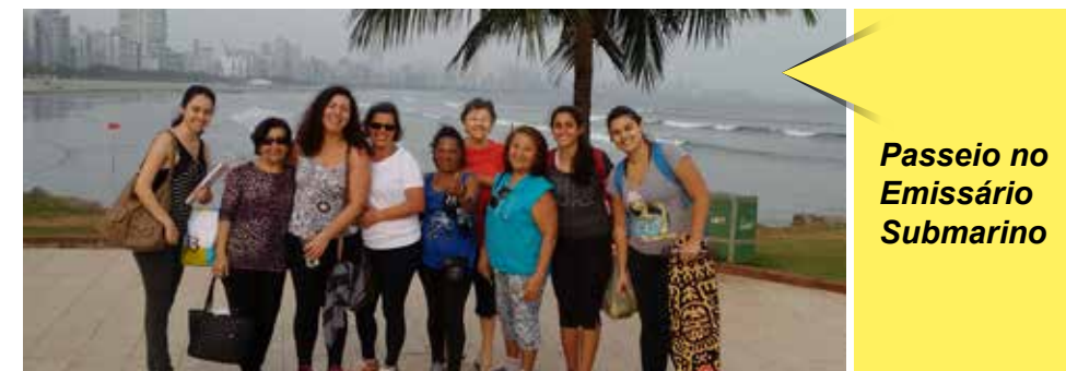
Passeio no Emissário Submarino