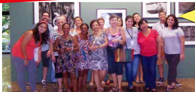
Exposição Sebastião Salgado no Sesc Santos