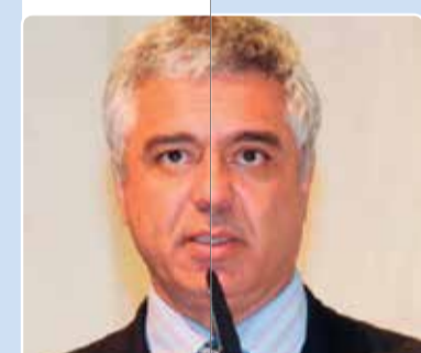
Major Olímpio (SD)