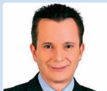
Celso Russomano (PRB)