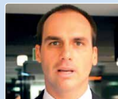
Eduardo Bolsonaro (PSC)