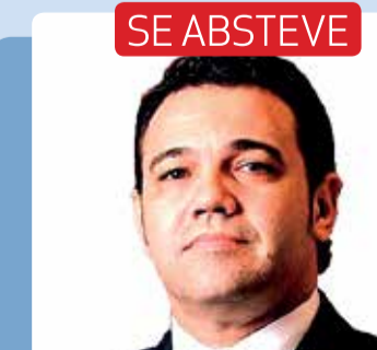
Pastor Marco Feliciano (PSC)